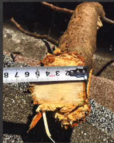
φ70までの樹木の枝や幹なら剪定可能です。

A company to make dreams come true... IWARE IWARE INDUSTRIAL Co., LTD.