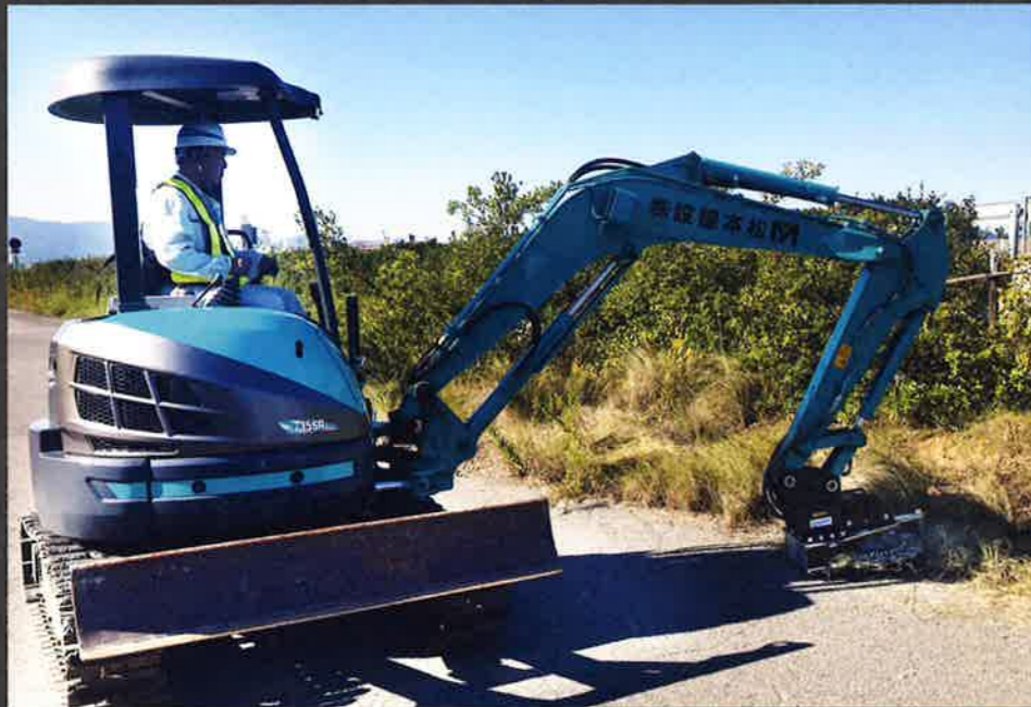
高速道路での草刈り作業風景。

私たちは、当製品をTOSA ULTRA CUTTER(トサ・ウルトラ・カッター)と命名致しました。