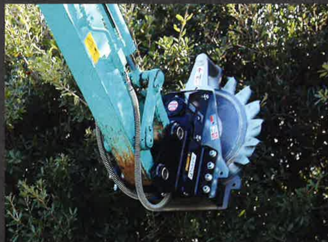
ウバメグサの剪定も楽々に出れます。

日本の侵略的外来種ワースト100に選ばれた刈り難い厄介な草、ウィーピングラブグラス(しなだれすすめがや)も簡単に刈ることができます。